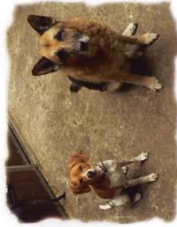
Eddi (auch „Tofli“ genannt)