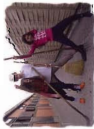
Abendveranstaltung: MaMa's next Flopmodell