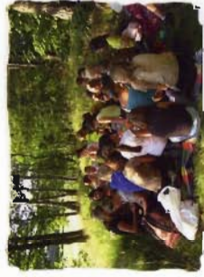
Abendveranstaltung: Picknick an der Aue