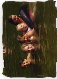
Ausflug ins Aquadives