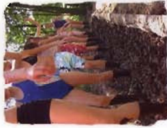
Ausflug in den Barfußpark