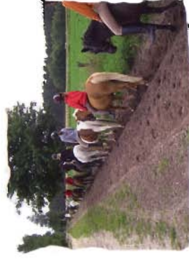
Abendliches Reiten zur Weide

Die Kinder und Jugendlichen werden bei uns in entsprechenden Gruppen bis zur Turnierreife gefördert. Theoriestunden, Seminare und Reitabzeichenlehrgänge runden unser Angebot ab.