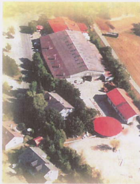
Die Reitanlage Konle in Ellwangen-Röhlingen aus der Vogelperspektive.

Dass da nicht viel Zeit für die Pferde bleiben könnte, ist jedoch weit gefehlt. In jeder freien Minute sind die Kinder im Stall. Wenn gerade mal kein Programm ist, wird den anderen, die mit Reiten dran sind, beim Pferdestriegeln und Satteln geholfen oder man schaut bei der Reitstunde zu. Da kann man ja auch einiges lernen. Chiara erzählt