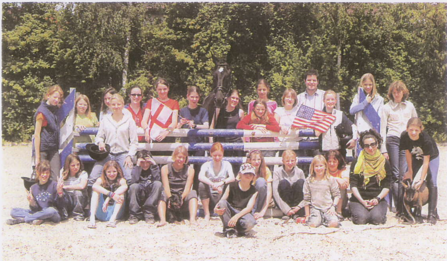
So schön kann Englisch lernen sein: 25 Kids verbanden in den Pfingstferien bei Familie Konle Sprach- und Reitkurs.