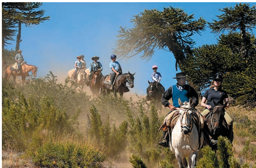
Impressionen von den Trails in den Anden

Flug bis Salta City für den Inka-Trail bzw. San Martin beim Pionier-Trail, Transfer. - Reisepass erforderlich.